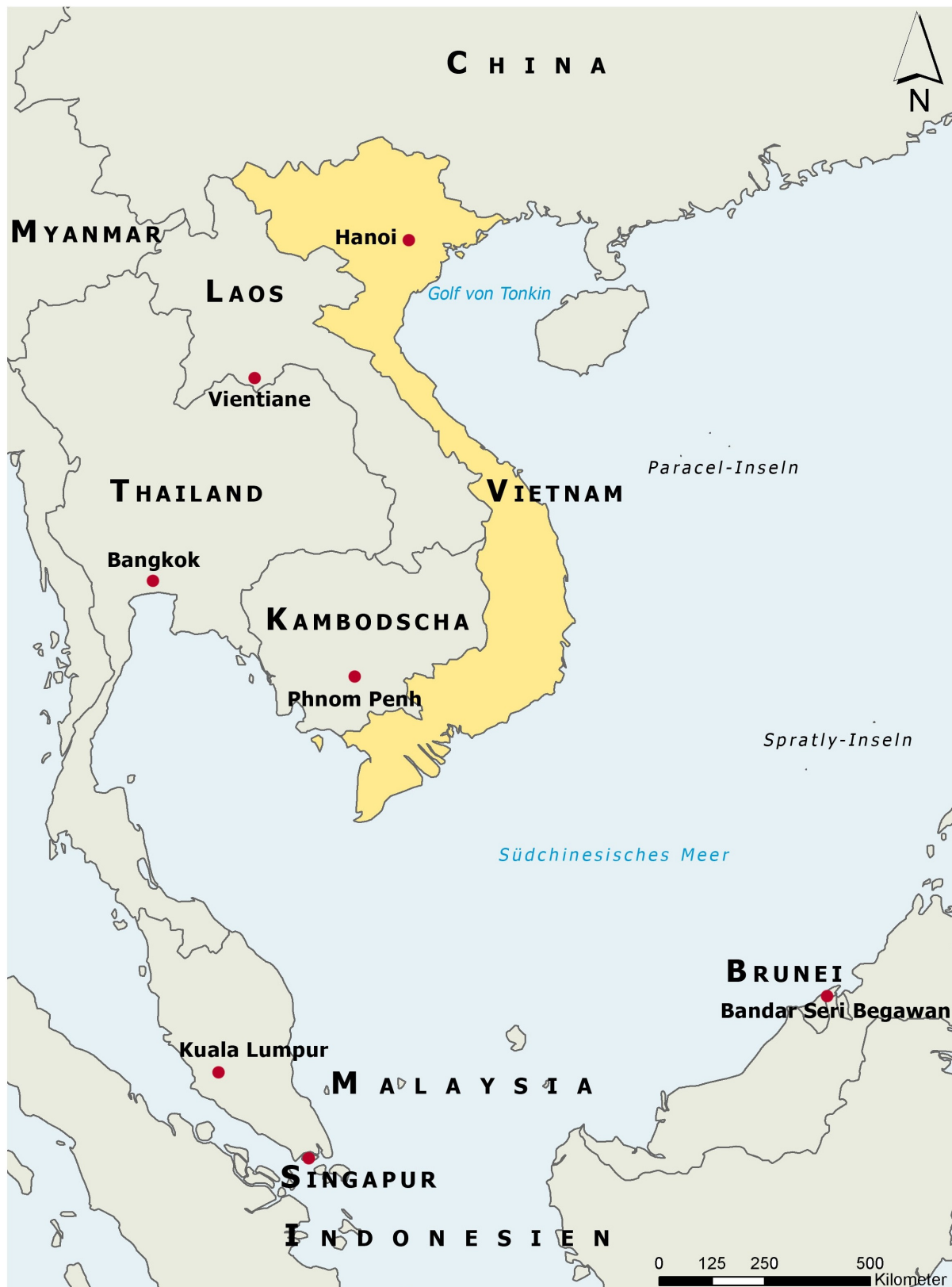
Abb. 2: Südostasien – politisch. Eigene Darstellung. Daten: ESRI